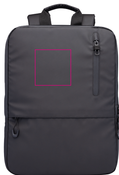
Abbildung oben 1:1

Laptop-Rucksack mit 2 großen Fächern (gepolstertes Laptopfach bis 16" und Hauptfach) mit 2-Wege Reißverschluss, erweiterbar durch zusätzlichen Reißverschluss, 1 Fronttasche mit versteckbarem Reißverschluss-Schieber als Mini-Karabiner (Diebstahlschutz) + zusätzliches Frontfach, expandiert 2 Netztaschen für Flasche und Schirm, verstärkter Standboden, Schlaufe zur Befestigung am Trolley, Tragegriff, versteckte Rucksackgurte, wasserabweisende Reißverschlüsse außen, widerstandsfähiges Material, spritzwassergeschützt (Wasserdichtheitsgrad IPX4), Kapazität von ca. 6 Liter auf ca. 14 Liter erweiterbar, Tarpaulin: 80% Polyester, 20% Polyurethan (PU), Polyester, Polyurethan, Tarpaulin (Plane), schwarz