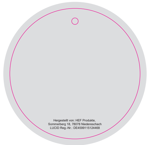
Rückseite / back side

Please refer to the tips on providing data in our important information.